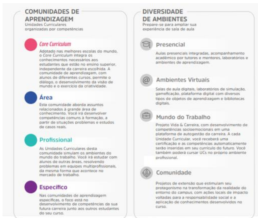
Figura 1 – Comunidades de aprendizagem e diversidade de ambientes

Assim, durante o seu percurso formativo, o estudante desenvolve, de forma flexível e personalizada, conforme perfil do egresso, as competências, conhecimentos, habilidades e atitudes de trabalho em equipe, resolução de problemas, busca de informação, visão integrada e humanizada.