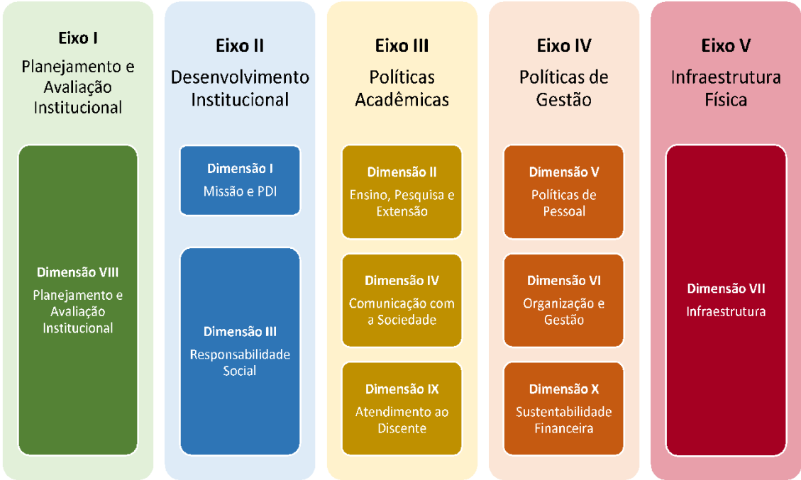
Figura 2 – Eixos e dimensões do SINAES