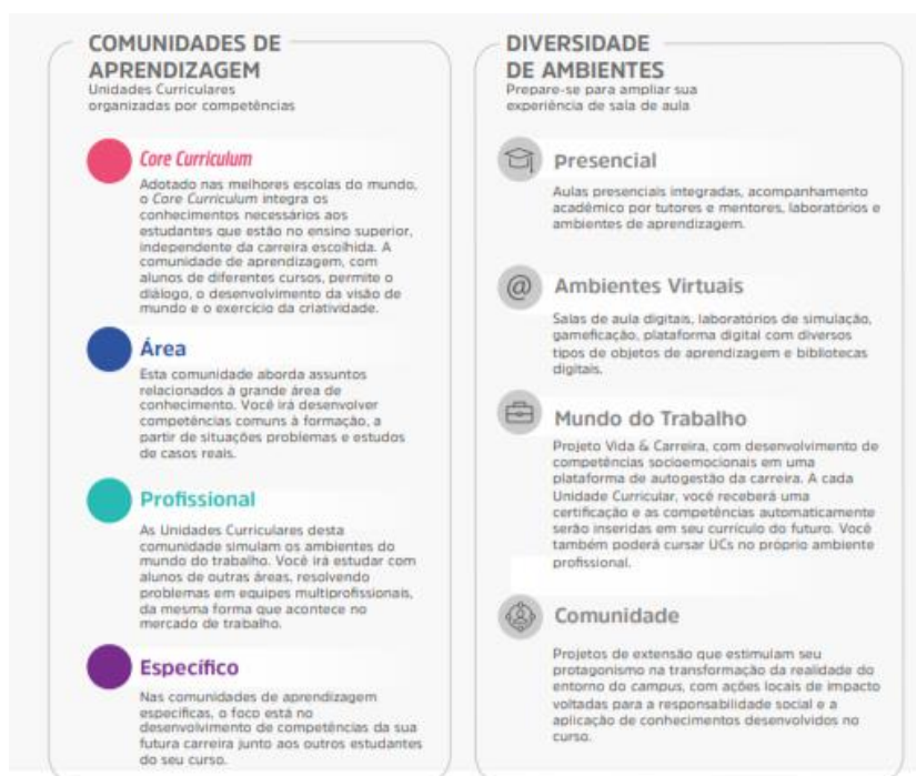
Figura 1 – Comunidades de aprendizagem e diversidade de ambientes

Assim, durante o seu percurso formativo, o estudante desenvolve, de forma flexível e personalizada, conforme perfil do egresso, as competências, conhecimentos, habilidades e atitudes de trabalho em equipe, resolução de problemas, busca de informação, visão integrada e humanizada.