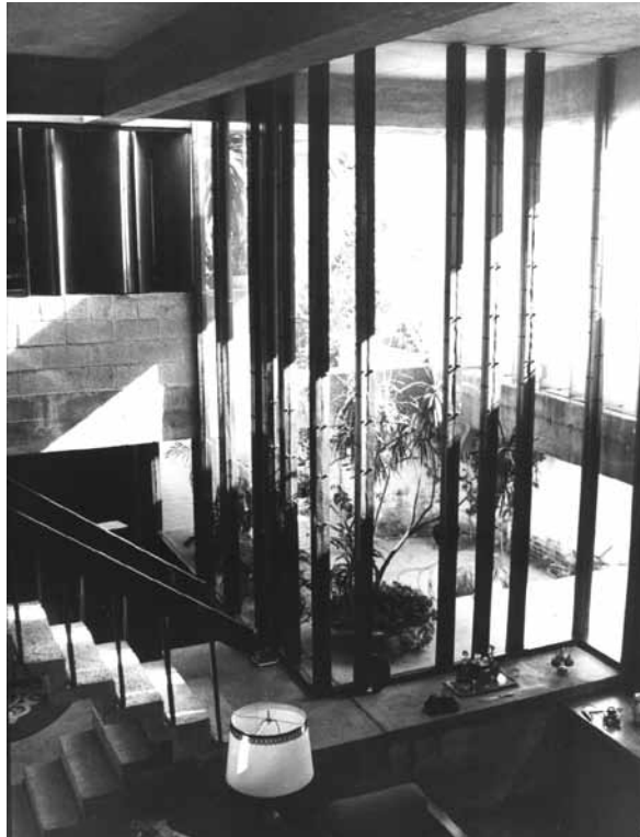
Figura 4 - Vista interna - detalhe dos caixilhos com caibros de telhado montados, Casa Cleômenes Dias Batista. Arquiteto: Rodrigo Lefevre, data: 1964, local: Butantã, São Paulo-SP, construtora CENPLA.

empreendeu, seja para a consolidação de um repertório de projeto de grande qualidade técnica e formal, mas principalmente pela sua contribuição ao estudo do debate entre os vários projetos de desenvolvimento da sociedade brasileira. (Figuras 4 e 5)