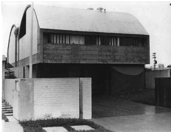
Figuras 1 e 2. Vista da cobertura da Residência Juarez Brandão. Sistema em duas lajes em abobadas. Arquitetos: Rodrigo Lefèvre e Flávio Império, local: Butantã, São Paulo-SP data: 1968, construtora CENPLA.