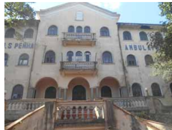
Figura 10. Seminário da Penha, edificação com valor afetivo para os moradores da área.

Uma das edificações indicadas, alvo de muita polêmica no bairro, é o antigo Seminário da Penha (Figura 10), localizado ao lado da Basílica, que foi objeto de pedido de demolição pelo proprietário em 2010. Ao mesmo tempo, em razão de contestação apresentada pelo Memorial da Penha, o Seminário foi objeto de estudo para possível abertura de processo de tombamento. O órgão municipal de preservação, o CONPRES, aprovou a demolição e negou o tombamento. A questão, contudo, ainda não foi concluída devido aos questionamentos formulados pelo Ministério Público de São Paulo. Os interessados no terreno do Seminário pretendiam ali erguer duas torres residenciais de 23 andares no local onde se encontra a antiga construção. Atualmente, o edifício que já foi Seminário dos padres redentoristas, sede da Administração Regional da Penha e hospital, encontra-se sem uso, sendo sua área livre utilizada para estacionamento.