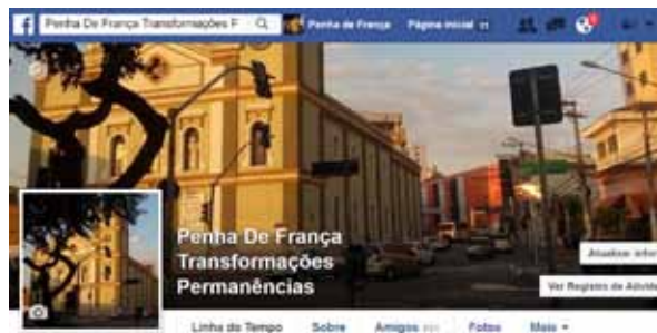
Figura 6. “Penha de França, Transformações e Permanências”, página criada pelos autores na internet.