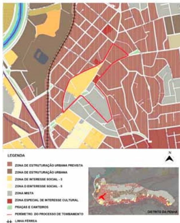
Figura 3. Zoneamento no bairro da Penha, 2016.

faces, como, por exemplo, o de planejamento urbano (RODRIGUES, 2009, p. 03)