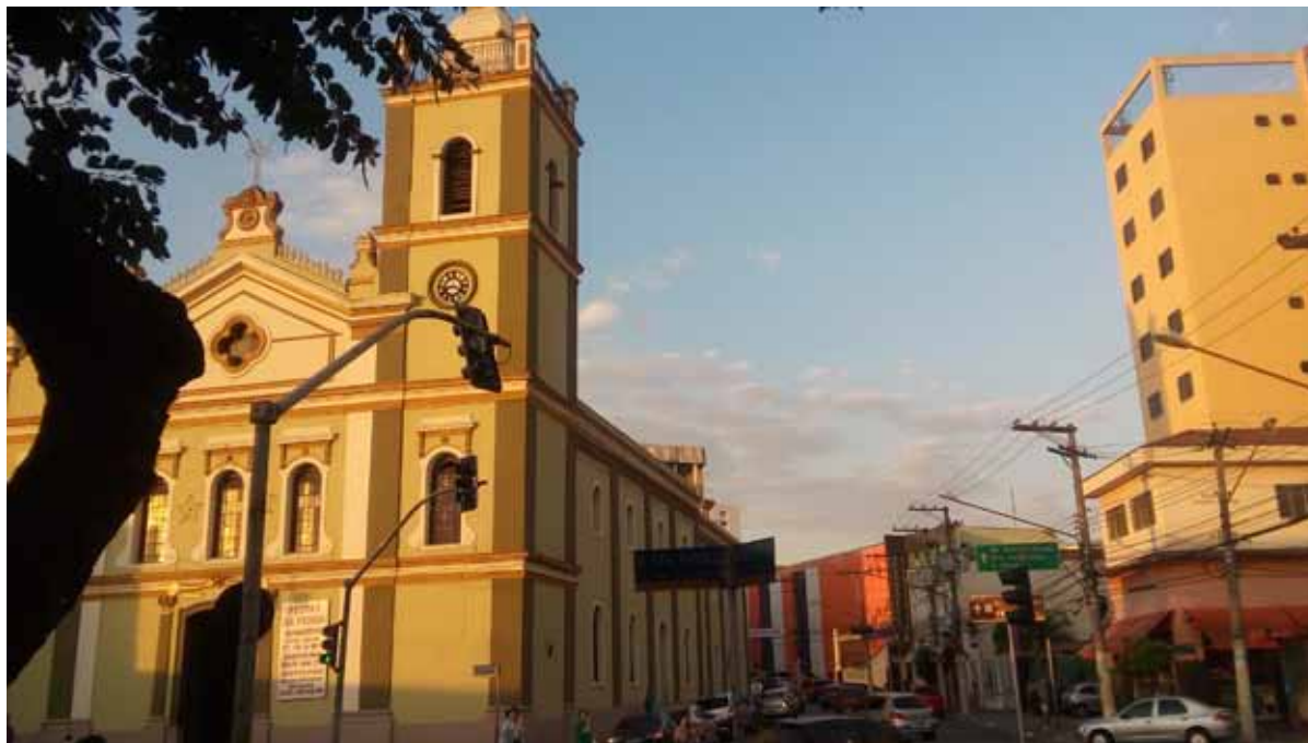
Figura 1. Santuário de Nossa Senhora da Penha, uma das edificações mais antiga do bairro, presente na paisagem desde 1668.

1. Esta Resolução de Abertura de Processo de Tombamento refere-se às áreas indicadas, na Lei municipal nº 13.885/2004, como Zonas Especiais de Preservação Cultural (ZEPEC) nos Planos Regionais Estratégicos das Subprefeituras (PRES), como o caso do centro histórico da Penha, indicado como ZE-