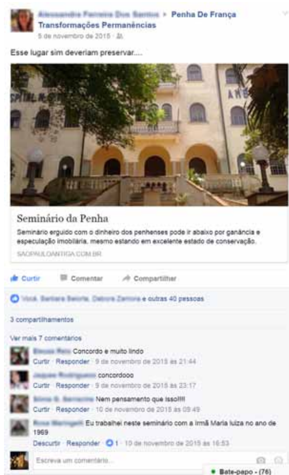
Figura 8. A página gerou publicações dos próprios moradores que buscavam discutir questões de preservação do bairro.

Foram recebidos 102 questionários respondidos, dos quais foram considerados 83 para análise, sendo elaborados gráficos para organizar as respostas e formular considerações gerais.