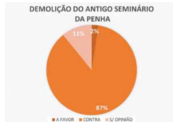
Figura 11. Resultados obtidos em relação à demolição do Seminário da Penha, 2016. Fonte: elaborado pelos autores.

Na opinião dos entrevistados, demolir o edifício é um “crime”, uma “afronta”, algo inconcebível para a história e memória do bairro. A maioria dos moradores que preza por sua revitalização é contrária à intervenção do mercado mobiliário neste caso (Figura 11).