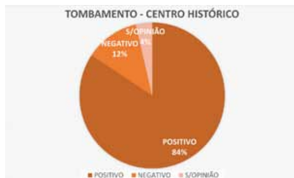
Figura 12. Posição dos entrevistados quanto ao tombamento do centro histórico do bairro.

Quando questionados a respeito do centro histórico da Penha, nota-se que mais de três quartos dos entrevistados são a favor de seu tombamento (Figura 12), alegando ser imprescindível sua proteção, inclusive para preservar a história do bairro frente às futuras transformações, uma vez que o local já foi muito desconfigurado.