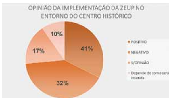
Figura 14. Porcentagem de moradores/frequentes a favor ou contra a implantação da ZEUP.

buscar novos procedimentos, por meio de ferramentas relacionadas às redes sociais. Trata-se, portanto, de uma metodologia que requer estudo e aprofundamento, pois não pretende ser uma abordagem científica de aplicação de questionários, cuja confiabilidade depende de critérios técnicos e precisos em relação às definições quanto ao público alvo, à amostra e seleção dos pesquisados, à formulação e avaliação do questionário, entre outros itens, que demandam utilização de técnicas consagradas de pesquisa estatística.