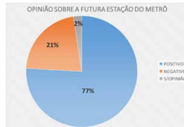
Figura 13. Porcentagem de moradores/frequentes a favor ou contra a nova estação de metrô.

Quanto aos elementos de transformação do bairro, a exemplo do projeto para a nova estação de metrô, próxima ao centro histórico, muitos se mostram otimistas (Figura 13), alegando que a Penha poderia finalmente ter uma estação de metrô, mesmo que sua proximidade com o centro possa vir a impactar sua conformação espacial.