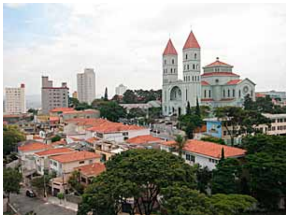
Figura 5. Colina penhense destacando a Basílica da Penha e sua área envoltória, 2009.

São Vicente de Paulo e a Escola Santos Dumont - esta última tombada em esfera municipal. Alguns edifícios mais recentes acabaram se tornando marcos no bairro, como o Centro Cultural, o Shopping Penha e o Mercado Municipal da Penha. Além das edificações, o traçado que conforma o tecido urbano do bairro revela-se como referência para os moradores e frequentadores da região - seja pela ladeira da Penha (situada no antigo ramal da Penha), onde haviam edificações importantes no bairro, seja pela praça 8 de Setembro, Avenida Penha de França e Rua Doutor João Ribeiro, principais ruas comerciais e que conectam o bairro à cidade.