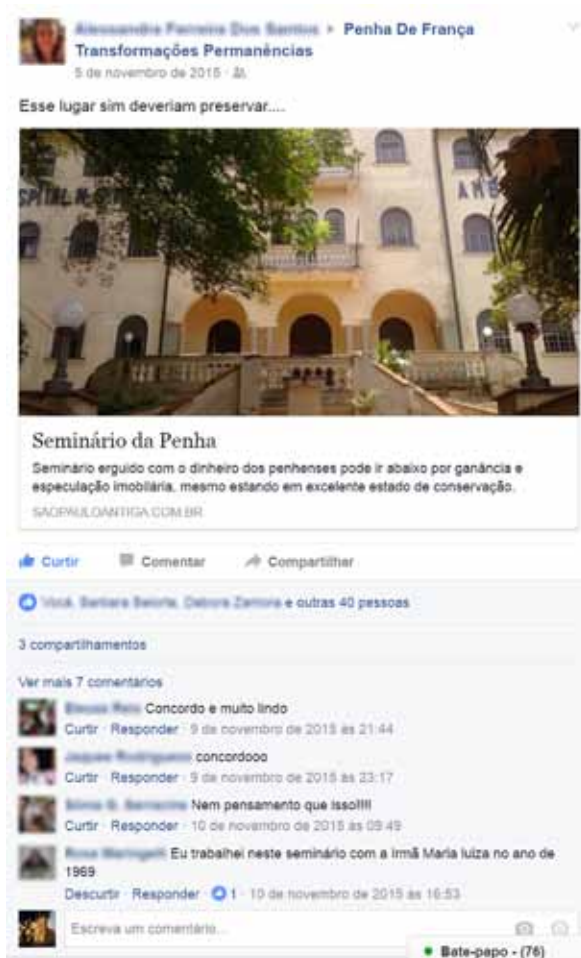
Figura 8. A página gerou publicações dos próprios moradores que buscavam discutir questões de preservação do bairro.

Foram recebidos 102 questionários respondidos, dos quais foram considerados 83 para análise, sendo elaborados gráficos para organizar as respostas e formular considerações gerais.