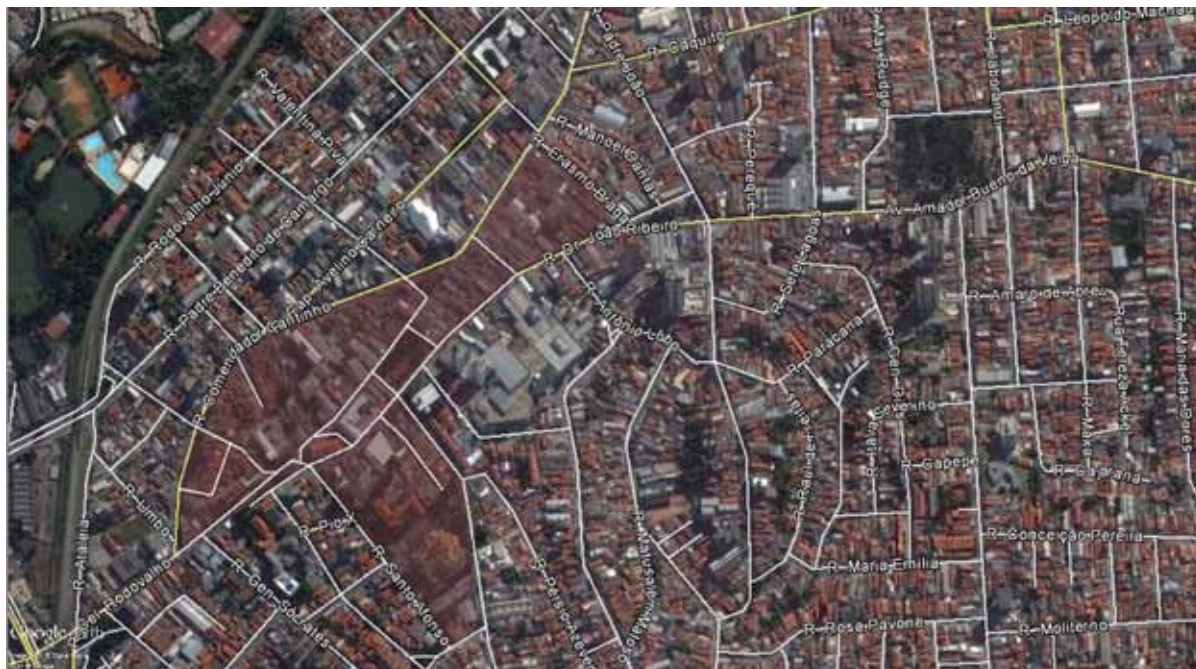
Figura 2. Perímetro em processo de tombamento municipal.

Em 2004, a elaboração e aprovação da LPUOS e dos PRES foram realizadas no mesmo momento, o que não ocorreu no recente processo de revisão destas normativas, pois a Lei de Zoneamento foi aprovada em 2015 e os PRES ainda estão em processo de revisão. Neste sentido, as diretrizes e disposições da Lei de Zoneamento irão incidir, posteriormente, nas escalas locais dos PRES. Como consequência, as diretrizes gerais de ordenamento urbano terão um grande impacto nas realidades locais - com suas condições particulares de desenvolvimento -, sem que estas tenham sido consideradas no momento oportuno. Isto se deve ao fato de que os distritos que integram as Subprefeituras