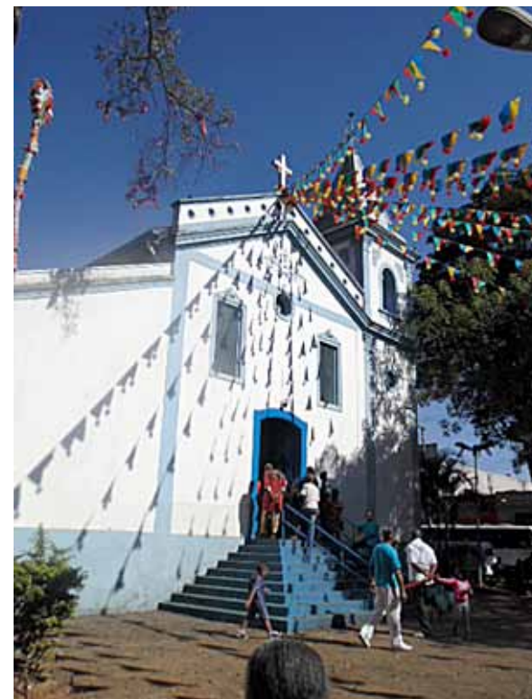
Figura 4. Igreja Nossa Senhora do Rosário dos Homens Pretos localizada na Penha, 2016.

ao longo das três igrejas localizadas no outeiro penhense: Igreja Nossa Senhora da Penha, Igreja Nossa Senhora do Rosário dos Homens Pretos (Figura 4) – as principais e mais antigas, sendo a segunda tombada pelo CONDEPHAAT – e a Basílica da Penha que, apesar de ser relativamente recente, faz parte da paisagem e dinâmica do bairro.