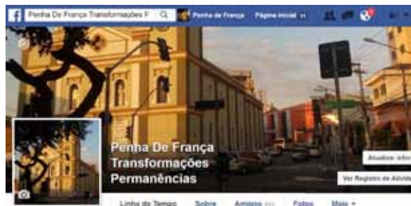
Figura 6. “Penha de França, Transformações e Permanências”, página criada pelos autores na internet.