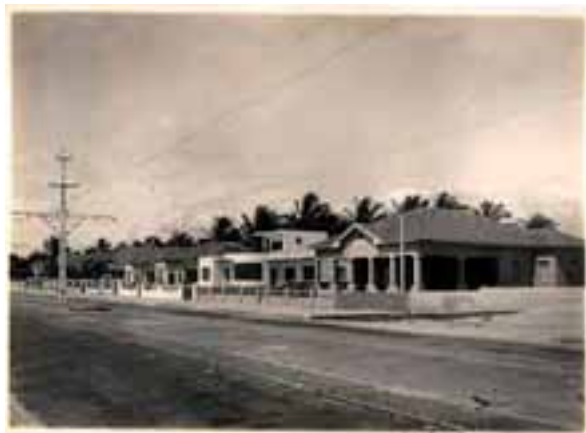
Figura 06. Aspectos e detalhes da arquitetura europeia presentes nas edificações situadas ao longo da Avenida Boa Viagem no princípio do século XX, quando ainda existiam os trilhos de bonde.

cações da cidade do Recife como o Casarão do Cordeiro, o Clube Líbano e a já demolida Padaria Capela, constituem tema relevante que mobiliza tanto as instituições de preservação como parte da sociedade civil, na tarefa de guardar para próximas gerações, elementos representativos do processo de formação da cidade ou aqueles que defendem a destruição do antigo para dar lugar à novas estruturas. Para Sechi (2006, p. 66) a dicotomia preservar/renovar manifesta as contradições da sociedade contemporânea quando trata das estruturas antigas: “por um lado, com o desejo de destruí-lo em nome do novo, no qual a contemporaneidade se explicita completamente; e, por outro lado, com a nostalgia de um passado no qual só nele mesmo parece possível reconhecer as identidades individuais e coletivas”.