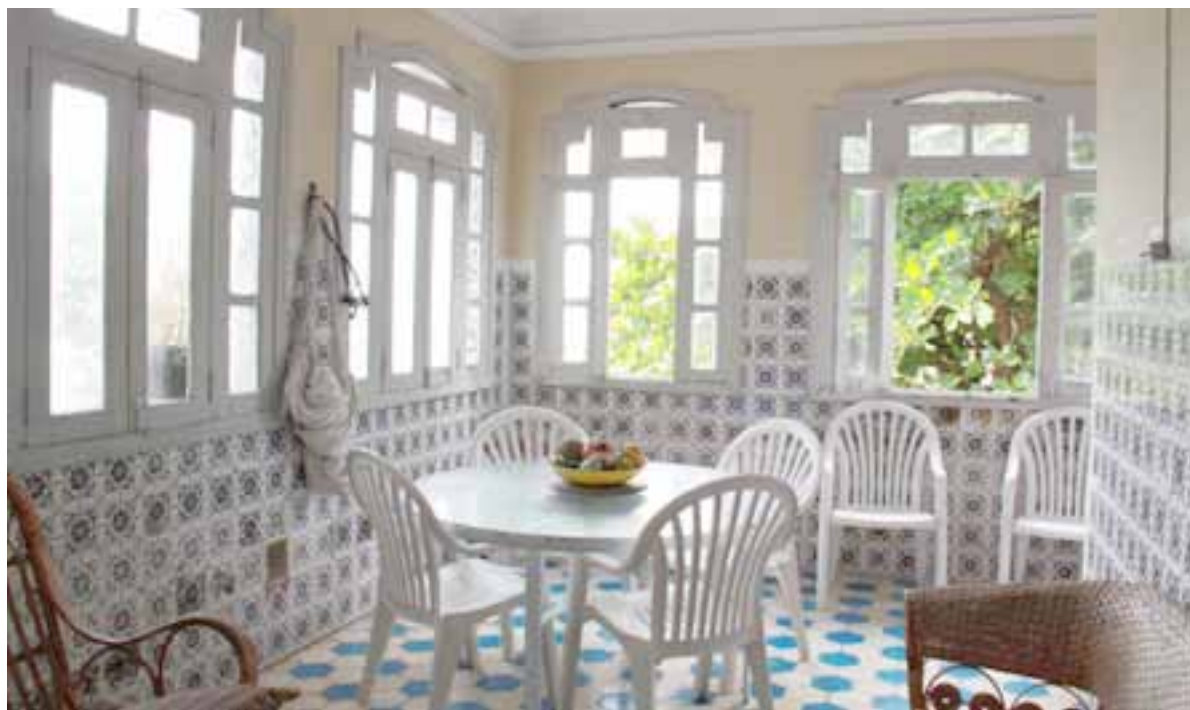
Figura 03. Varanda de um dos apartamentos. Fotografia: Nani Azevedo, 2011.