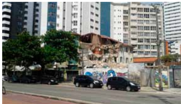
Figura 07. Registro do estado primeira tentativa de demolição do Edifício Caiçara em 2011, suspensa através de decisão judicial.