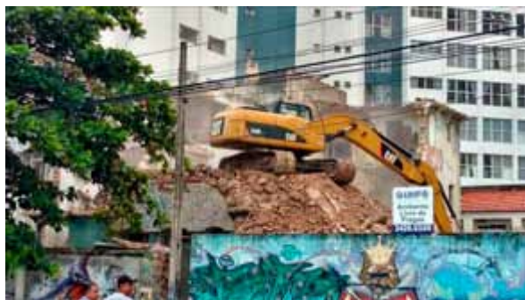
Figura 08. Registro da demolição do Edifício caiçara em 07 de abril de 2016.

partir da venda de seus terrenos, a construção de edificações de dezenas de pavimentos, favorecendo um processo de renovação urbana do lugar. O tombamento ou a preservação do Caiçara automaticamente lhe negaria este valor econômico de troca – motivação das pelejas judiciais que o acompanharam até sua demolição final em 2016 (figuras 07 e 08).