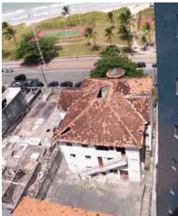
Figura 02. Vista superior do Edifício Caiçara onde é possível visualizar os dois blocos, o frontal e o de fundos. Fotografia: Nani Azevedo, 2011.

Já o segundo bloco (figura 05), situado nos fundos do terreno, era constituído de garagens térreas e quartos de serviços de cada apartamento no primeiro pavimento. Uma herança das construções coloniais, onde havia uma separação das áreas sociais e serviço da casa.