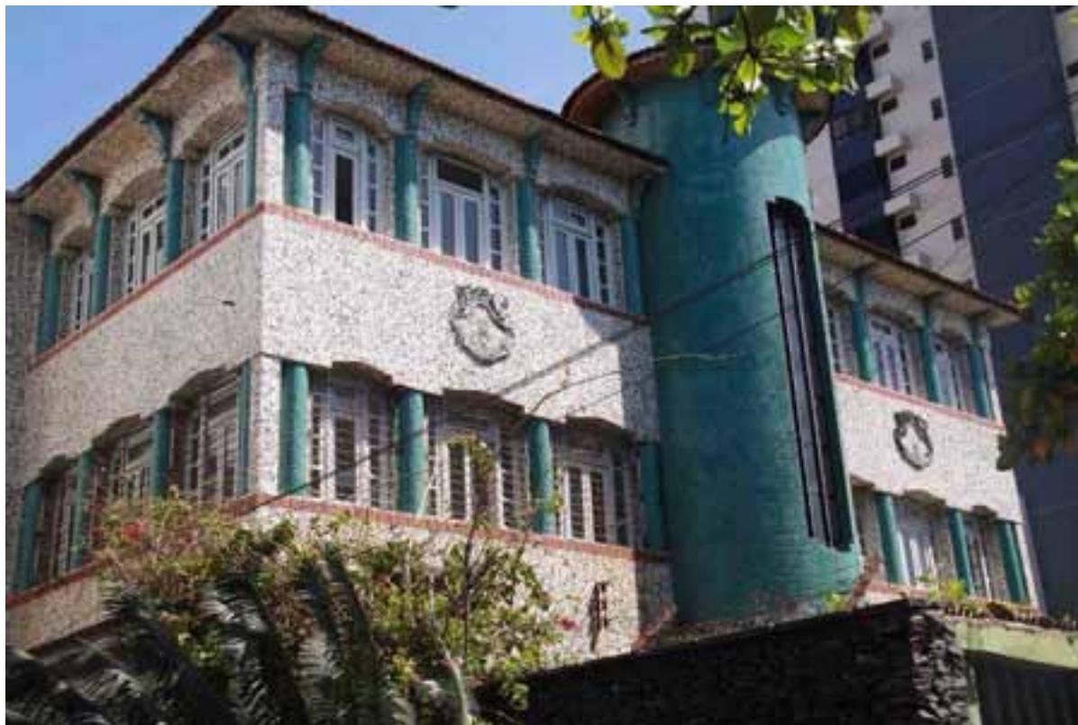
Figura 01. Vista da fachada frontal do Edifício Caiçara em 2011, quando do início das discussões sobre a sua preservação.

Considerado um edifício diferente do padrão construtivo da cidade, sua tentativa de preservação lançou polêmica e questionamentos no meio arquitetônico, pois, muitos profissionais da área da arquitetura questionavam sua importância como objeto de preservação; tanto por não se constituir exemplar de uma arquitetura original, ou exemplar do Movimento Moderno praticado na cidade em sua época, nem tão pouco ser um original antigo, representativo da formação colonial da cidade ou de séculos posteriores (XVIII ou XIX). Para muitos, o edifício não passava de um