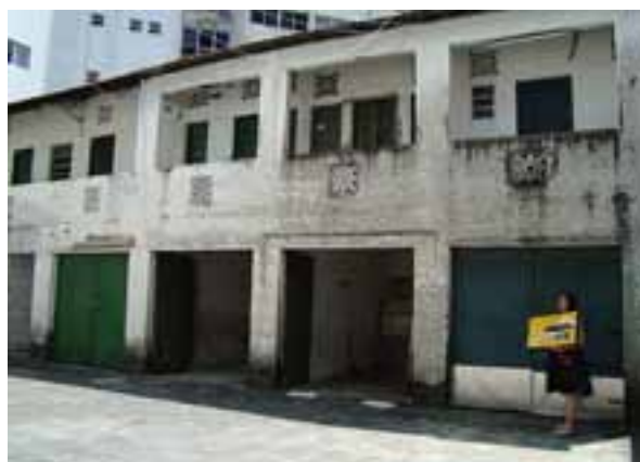
Figura 05. Vista do segundo bloco, situado nos fundos do terreno, constituído de garagens térreas e quartos de serviços de cada apartamento no primeiro pavimento. Fotografia: Nani Azevedo, 2011.

Vale ressaltar que abrigar excentricidades arquitetônicas como o Caiçara - amadas por uns e odiadas por outros - fez parte do processo de ocupação dos lotes lindeiros à referida avenida, que abrigou edificações como a já demolida casa denominada de “Navio”, a preservada casa conhecida por “Castelinho” e tantas outras edificações que importaram detalhes da arquitetura europeia (figura 06). Essas edificações, em sua época, passaram a constituir a identidade do lugar. Sobre esse aspecto que tange a representação formal do bem cultural enquanto bem representativo de uma identidade, que neste caso, trata da edificação e as suas distintas manifestações simbólicas, Hall (2006, p. 71) argumenta que: